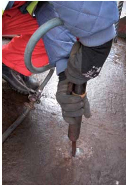
Naaldbikhamer; zeer relevant voor hand-arm trillingen.

Het Activiteitenbesluit heeft standaard geluidgrenswaarden die gelden bij gevoelige bestemmingen rondom het bedrijf. Deze waarden zijn 50 dB(A) in de